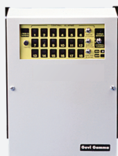
Até 18 laços

Conheça nossa Linha Completa de Produtos ONLINE