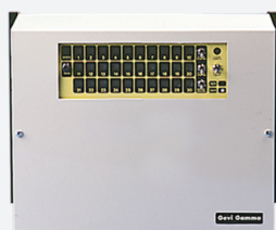
Até 30 laços